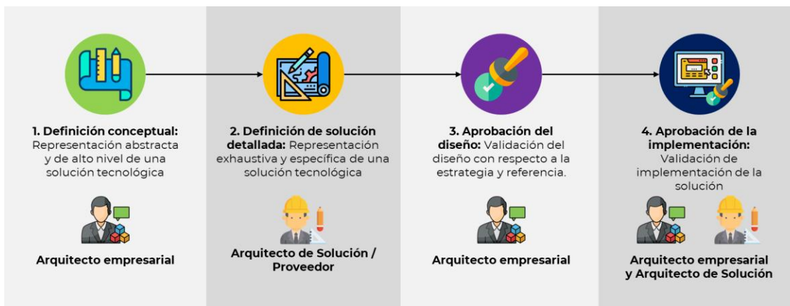
Ilustración 3. Modelo de gobierno de arquitectura – estado objetivo

arquitectura de referencia de la Entidad. A continuación, la Ilustración 3. representa el modelo de arquitectura de la Agencia.