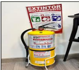
Multipropósito (6). Distribuidos 5 en el 2do piso y 1 en el 3er piso.