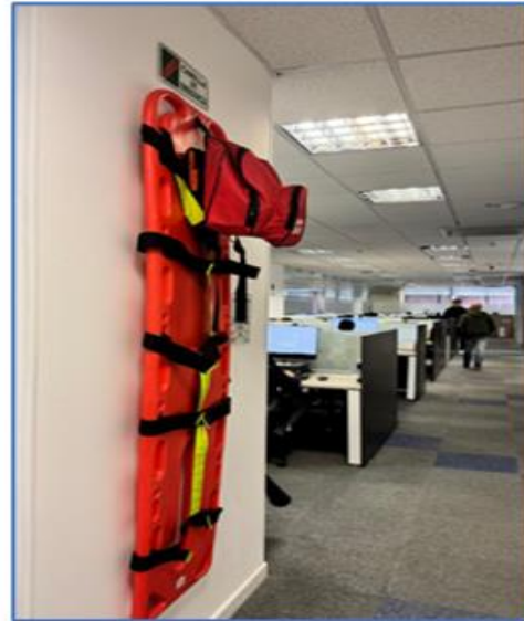
La camilla ubicada en el 3er piso.