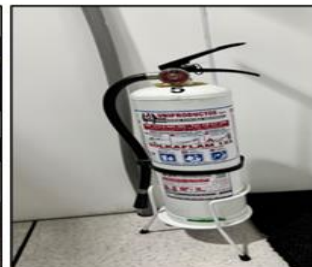
Solkaflam 123 (1). Ubicado en el 2do piso.