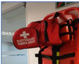
Botiquín de maletín ubicado en el 3er piso