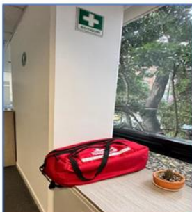
Botiquín ubicado en la secretaria general, 2do piso

Este botiquín no está en un lugar muy apropiado, se recomienda su reubicación o colocar otra presentación de botiquín como maletín que se puede tener colgado, así mismo durante la inspección Al realizar la inspección Física se observó que faltan los siguientes elementos (Venda Elástica 2X5, 3X5 y 5X5 Yards, Esparadrapo de tela Rollo de 4", Solución Salina de 250 cc o 500 cc, Alcohol ) y adicionalmente está vencido el Yodopovidona (Jabón quirúrgico).