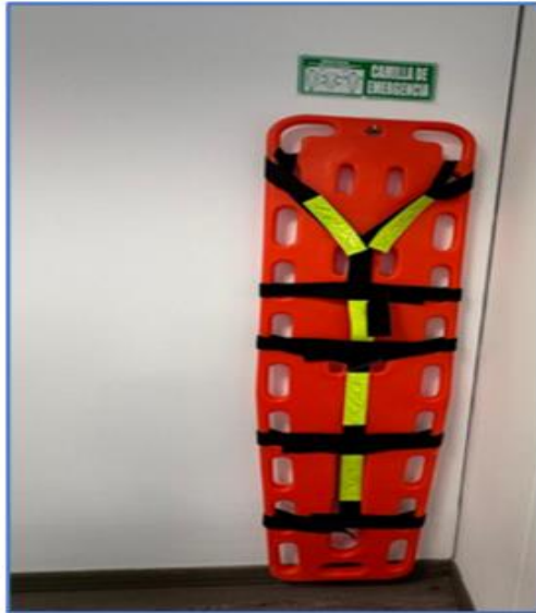
La camilla ubicada en el 2do piso en la OASTI.