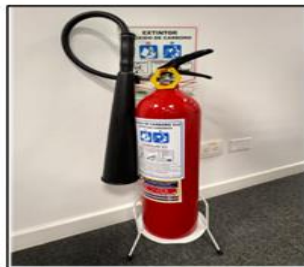
Dióxido de Carbono B/C (10), distribuidos 4 en el 2do piso y 6 en el 3er piso.

La Agencia maneja 3 tipo de extintores como se indica a continuación: