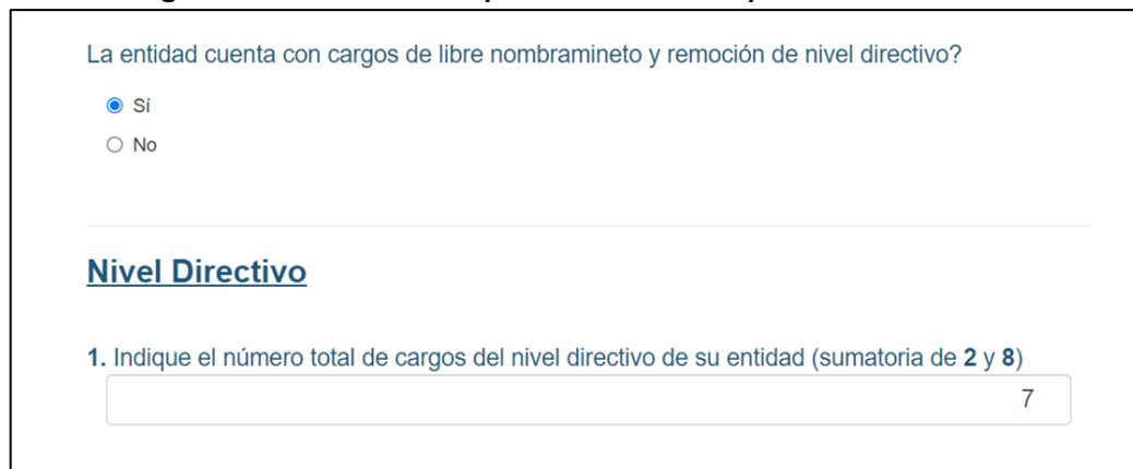
Imagen No. 2. Pantallazo reporte formulario Ley de Cuotas del DAFP

A continuación, se presentan las respuestas que la Coordinación de Talento Humano emitió a lo requerido, a saber: