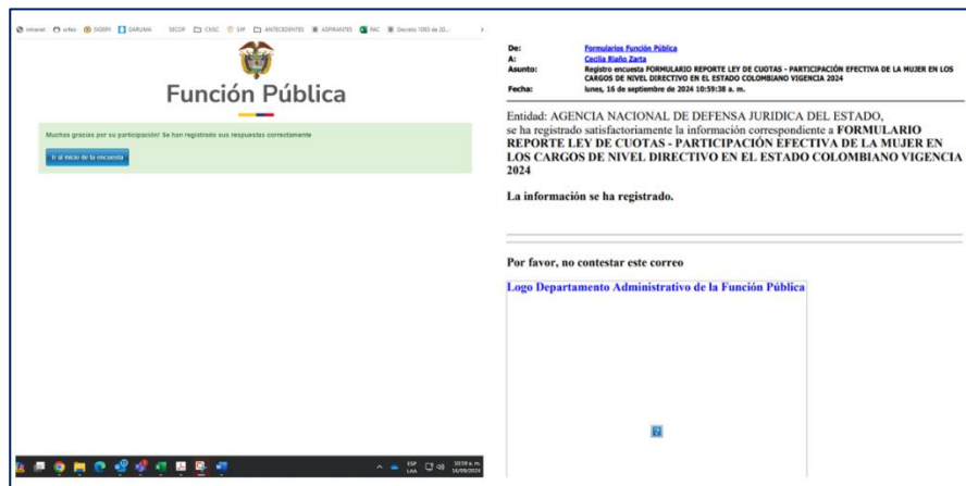
Imagen No. 5. Pantallazo Registro Encuesta Formulario Reporte Ley de Cuotas

Finalmente, el Grupo de Gestión de Talento Humano adjunto soporte del reporte efectuado a satisfacción en el aplicativo del DAFP.