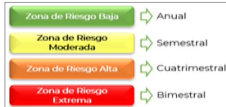
Imagen No. 3 Seguimiento de acuerdo con el Nivel de Riesgo Residual