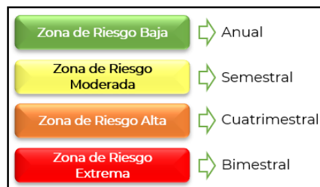
Imagen No. 4 Seguimiento de acuerdo con el Nivel de Riesgo Residual