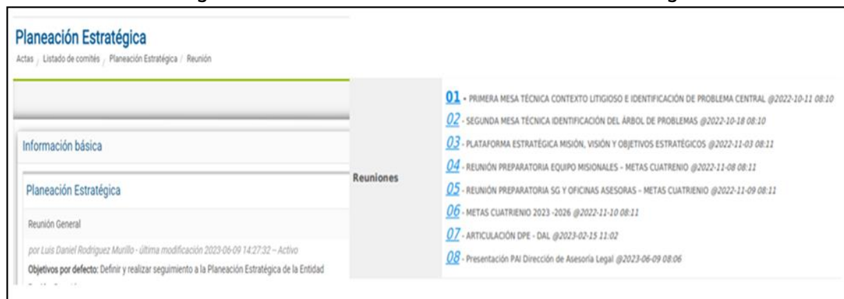
Imagen. 1. Pantallazo relación de Actas Planeación Estratégica

Se evidenció que mediante la Resolución 006 del 10 de enero del 2023 se aprobó el Plan Estratégico 2023, como un instrumento de gestión que orienta la misión de la entidad en el cuatrienio, en ella se definen la Misión, Visión y objetivos estratégicos 2023-2026; así mismo, se evidenció que para su construcción se realizaron diferentes reuniones con las dependencias como se indica a continuación y cuyas actas de reunión reposan en la herramienta Daruma.