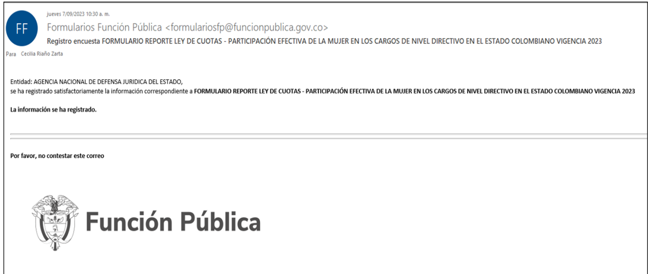
Imagen No. 5. Pantallazo Registro Encuesta Formulario Reporte Ley de Cuotas.

Finalmente, el Grupo de Gestión de Talento Humano adjunto soporte del reporte efectuado a satisfacción en el aplicativo del DAFP.