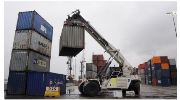
Pie de foto: La decisión se adopta ante la alta demanda de esta clase de bienes, indispensables en estos momentos de coyuntura sanitaria.

Por alta demanda, Gobierno Nacional restringe exportaciones de 24 bienes necesarios para prevenir y contener el coronavirus